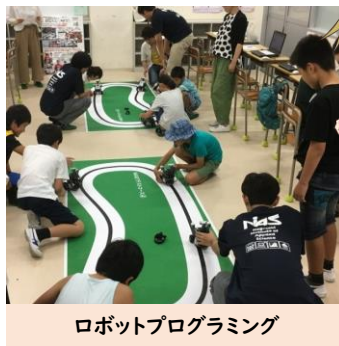
ロボットプログラミング