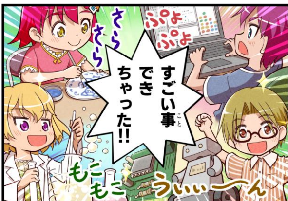
表紙イラスト・漫画 赤瀬よぐ